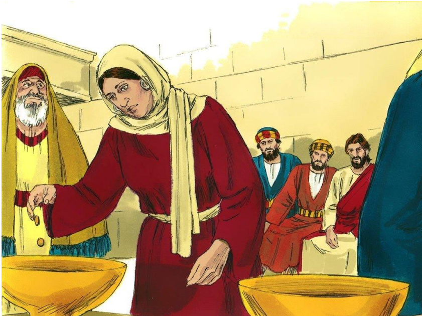
De arme weduwe (Lucas 21 vers 2)